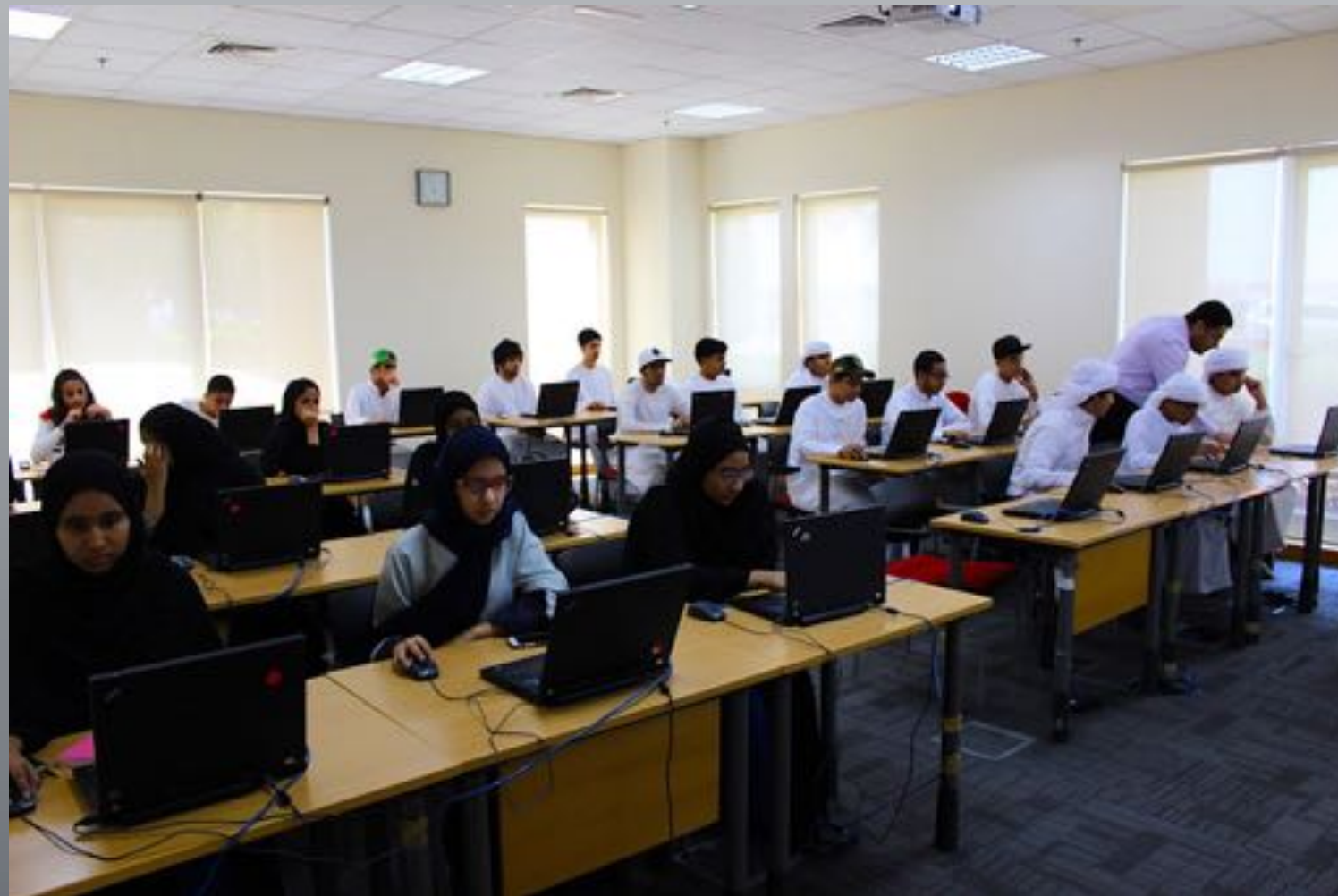
Summer Trainings for Students